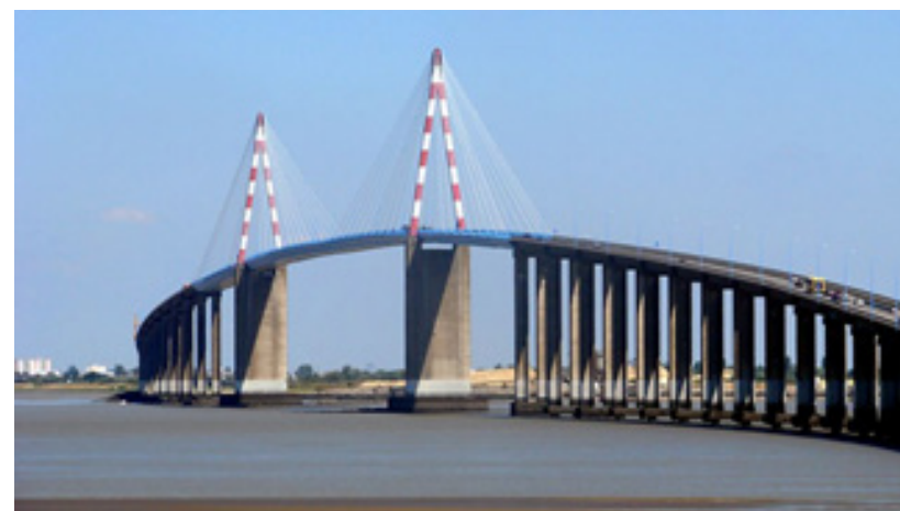
Pont de Saint-Nazaire Loire estuaire